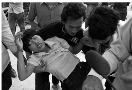
图片说明2: 工人在工厂昏厥, 2011年